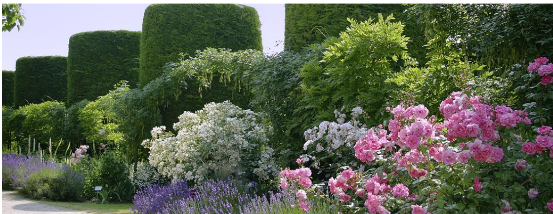
Landhaus Ettenbühl: Englischer Garten, Cafe & Restaurant, Rosen- und Staudengärtnerei www.landhaus-ettenbuehl.de

Nach dem Frühstück im Hotel heißt es Abschied nehmen, oder individuell vor der Heimreise noch etwas anschauen, z.B. das Automobilmuseum Cité de l'Automobile in Mulhouse (F) (Bugatti Sammlung der Gebr.Schlumpf)